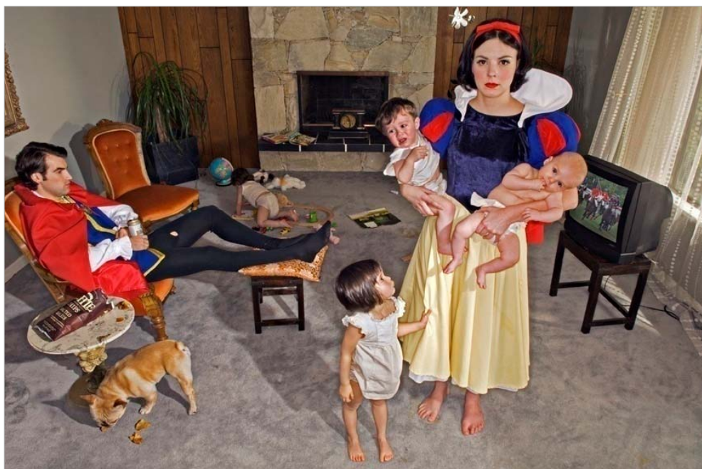
Fig. 1. Dina Goldstein, Snowy ©. Reproducido con permiso de la artista.

Como Rego, la fotógrafa israelí residente en Canadá Dina Goldstein lee los cuentos desde la modernidad. En su original serie de fotografías Fallen Princesses (2009) Goldstein baja a estos personajes del pedestal al que la imaginación Disney los ha elevado y destruye su mitología visual y de género mediante el recurso del humor. Snowy (fig. 1) satiriza la fantasía romántica del “felices para siempre” con su retrato de la vida de casada de Blancanieves. El ‘trono’ que le está reservado aparece vacío frente al que ocupa su esposo, sentado ante el televisor viendo un partido de polo. Mientras, Blancanieves ha de ocuparse sola de sus cuatro hijos, a dos de los cuales sostiene en brazos. La expresión de este personaje ante la cámara revela la historia de sacrificio doméstico (no escrita en los cuentos) que aguarda a la esposa. Al igual que Sexton, Goldstein da continuidad al relato como medio para deslegitimar la artificiosidad de un presente eterno y apolíneo ajeno al discurrir de la vida.